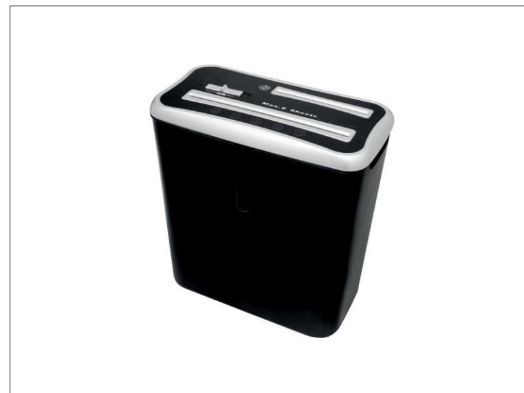
Skartovací stroj Wallner XD 805CD